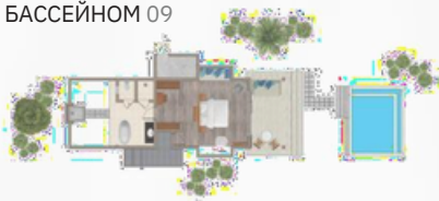
SUNSET BEACH VILLA С БАСЕЙНОМ 09