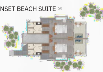
SUNSET BEACH SUITE 50

58 м2 — 1 спальня / Возможно объединение номеров, соединенных межкомнатной дверью.