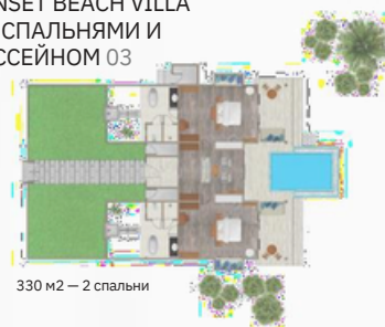
SUNSET BEACH VILLA С 2 СПАЛЬНЯМИ И БАСЕЙНОМ 03