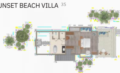
SUNSET BEACH VILLA 35

58 м2 — 1 спальня / Возможно объединение номеров, соединенных межкомнатной дверью.